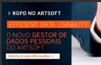
Página inicial da Plataforma

Para facilitar a atualização dos dados inseridos no ARTSOFT, foi criada uma plataforma para que o seu cliente possa verificar diretamente os dados.