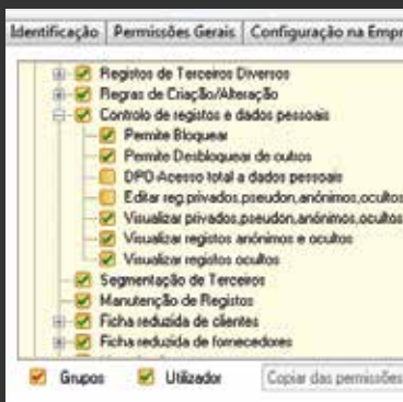
Registo de utilizadores e permissões

Adicionou-se também um conjunto de permissões, que permite que a sua empresa defina o que cada utilizador poderá fazer no campo dos dados pessoais.