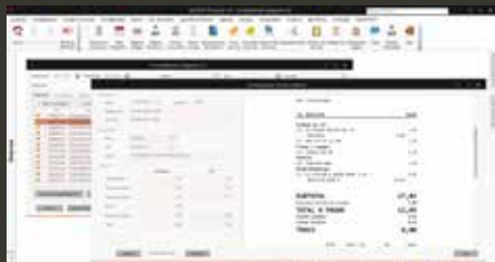
Detalhes de documento.

É possível também efetuar o lançamento manual de documentos sem QR Code.