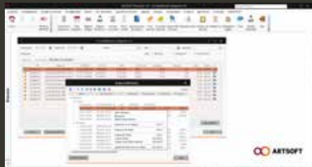
Arquivo Contabilidade Inteligente

A solução inclui um arquivo eletrónico detalhado que permite um armazenamento seguro de documentos fiscais com ou sem QR Code. Permite ainda a geração do ficheiro em formato SAF-T com o arquivo eletrónico – útil para inspeções efetuadas pela AT.