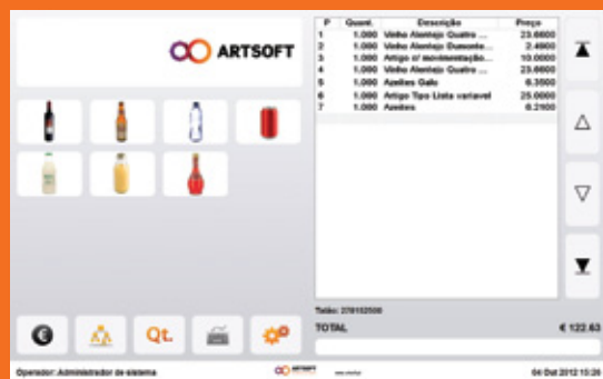
>> INTERFACE VERSÃO TOUCH